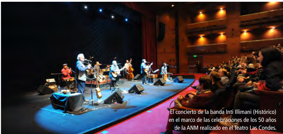
El concierto de la banda Inti Illimani (Histórico) en el marco de las celebraciones de los 50 años de la ANM realizado en el Teatro Las Condes.