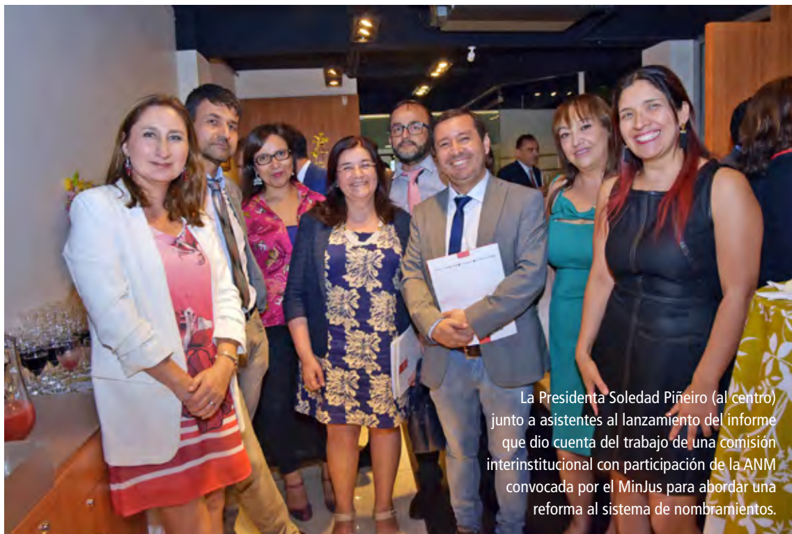
La Presidenta Soledad Piñeiro (al centro) junto a asistentes al lanzamiento del informe que dio cuenta del trabajo de una comisión interinstitucional con participación de la ANM convocada por el MinJus para abordar una reforma al sistema de nombramientos.

objeto de restar a jueces y juezas de la desgastante discusión que año a año se produce en el Congreso y que debiera serles ajena en resguardo de la independencia de la función, en línea con lo que prescriben instrumentos como el Código Iberoamericano de Ética Judicial o la propia Carta Universal del Juez.