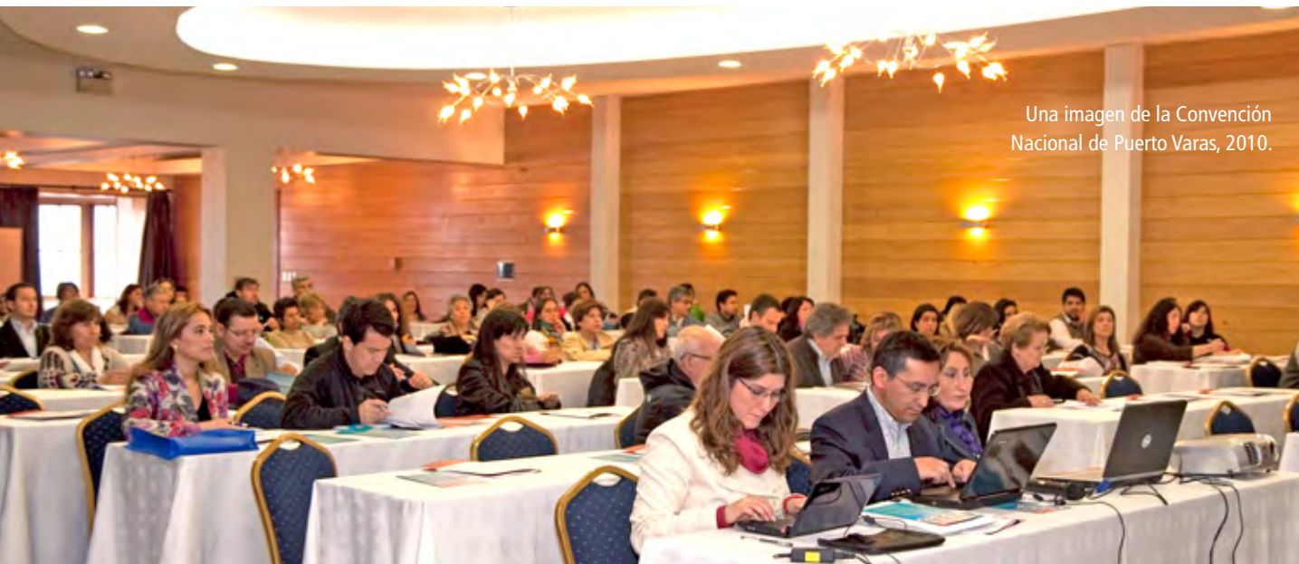
Una imagen de la Convención Nacional de Puerto Varas, 2010.