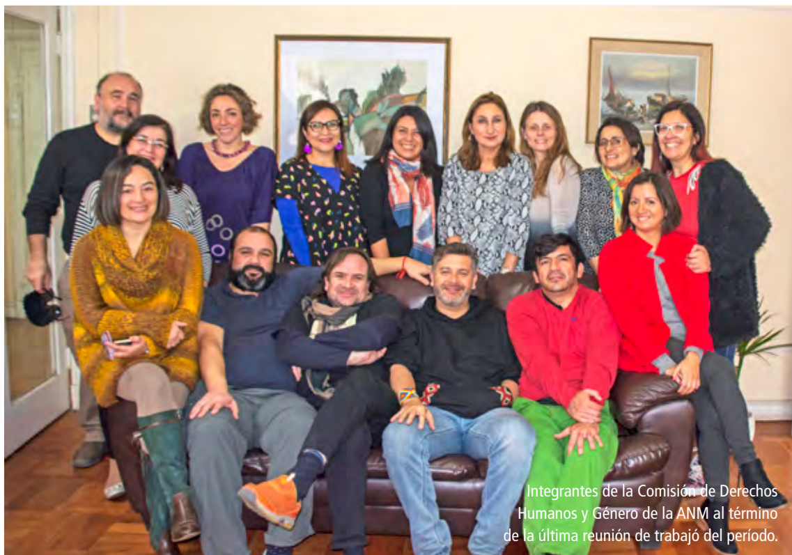
Integrantes de la Comisión de Derechos Humanos y Género de la ANM al término de la última reunión de trabajo del período.

y amplio, sin serlo y que incluso carecía de información sólida sobre la que trabajar, sin real injerencia en decisiones que pudieran tomarse dentro de la esfera de las atribuciones en que el Poder Judicial puede hacerlo, sin excederse de las encomendadas por la Constitución y las leyes, pero que podrían ser adoptadas con real y objetivo conocimiento de las distintas realidades y necesidades a nivel país”.