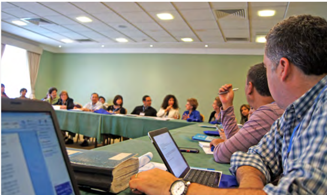
Socios y socias pueden integrar comisiones y departamentos para el estudio de diversos temas de interés gremial. En la foto, la Comisión de Jubilación Digna y Fraternal durante la Convención de Arica 2014.

respectivo reglamento; c) Presentar cualquier proyecto o proposición al estudio del Directorio Nacional, el que debe discutirlo en la reunión más próxima posible. Si se tratare de materias de competencia de la Convención, deberá ponerlas en conocimiento de la Junta Nacional, la que decidirá su inclusión o rechazo en la Tabla de la Convención Ordinaria; d) Imponerse de los registros de actas, registros de socios y demás registros que establezcan los reglamentos; e) Disfrutar y hacer uso de los servicios y beneficios que otorgue la Asociación en conformidad con sus Estatutos y Reglamentos; f) Participar en las actividades que programen los diversos organismos, departamentos y comisiones de la Asociación; g) Requerir amparo gremial, de