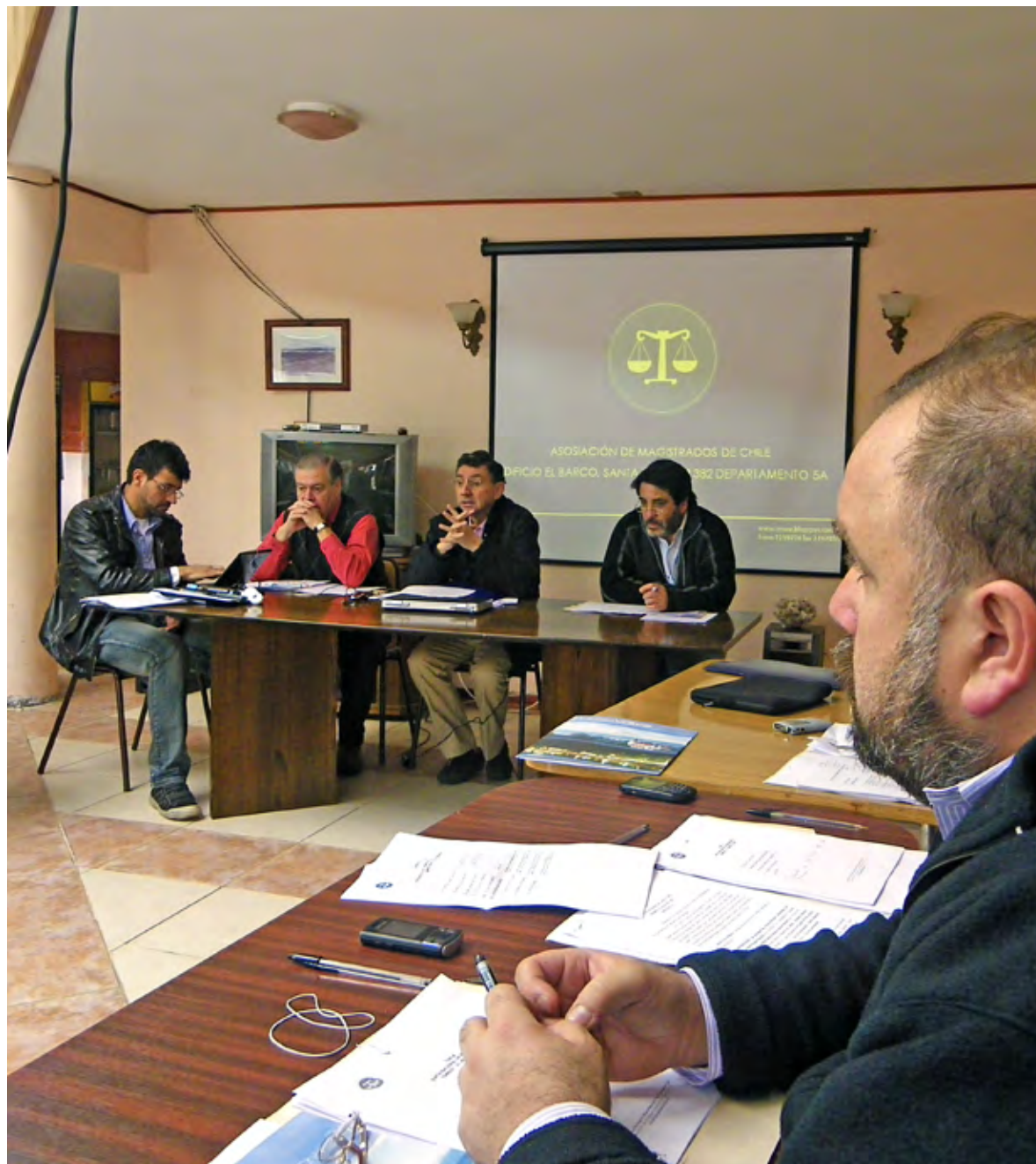
Dirigentes debaten durante el curso de una Junta Nacional de Presidentes realizada en el Centro Vacacional Tongoy en 2011.