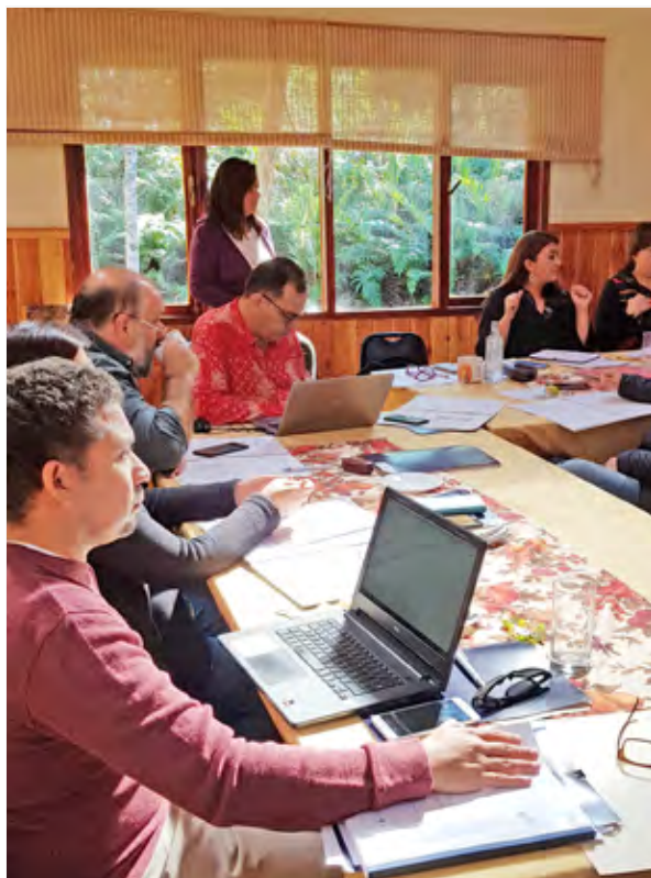
La Junta Nacional reúne al Directorio con las Presidentas o Presidentes de las asociaciones regionales. En la imagen, la reunión efectuada el 14 de marzo de 2019.