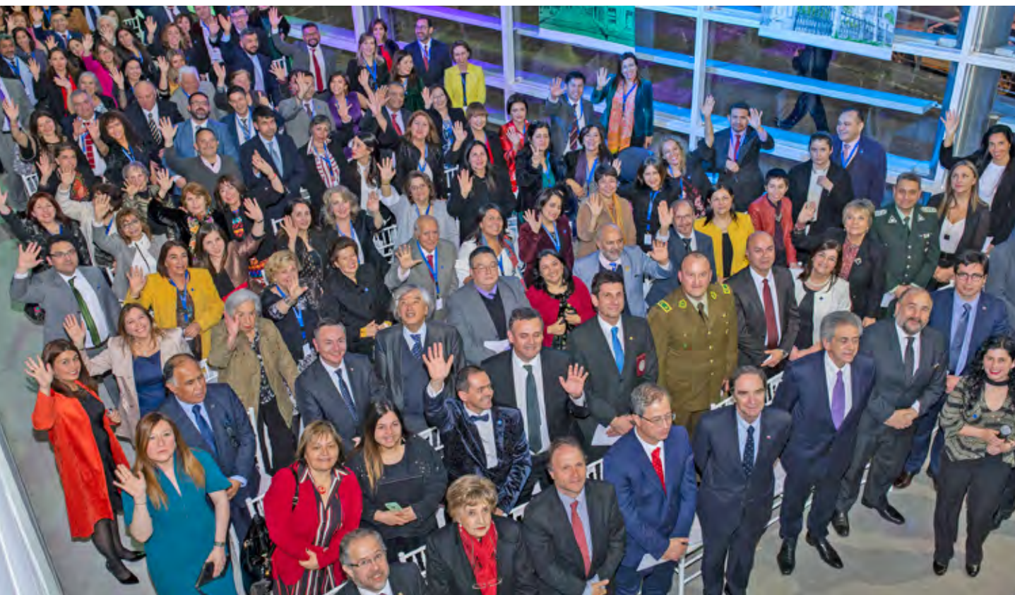
Durante la Convención Nacional de Valdivia 2018 (octubre) culminó la celebración de los 50 años de la ANM. En la imagen, socias, socios e invitados/as en la ceremonia de inauguración.

En la ANM todos los asociados y asociadas son iguales entre sí y todos/as ejercen sus derechos y cumplen sus deberes con prescindencia de la ubicación que tengan o hayan tenido en el Escalafón Primario del Poder Judicial.