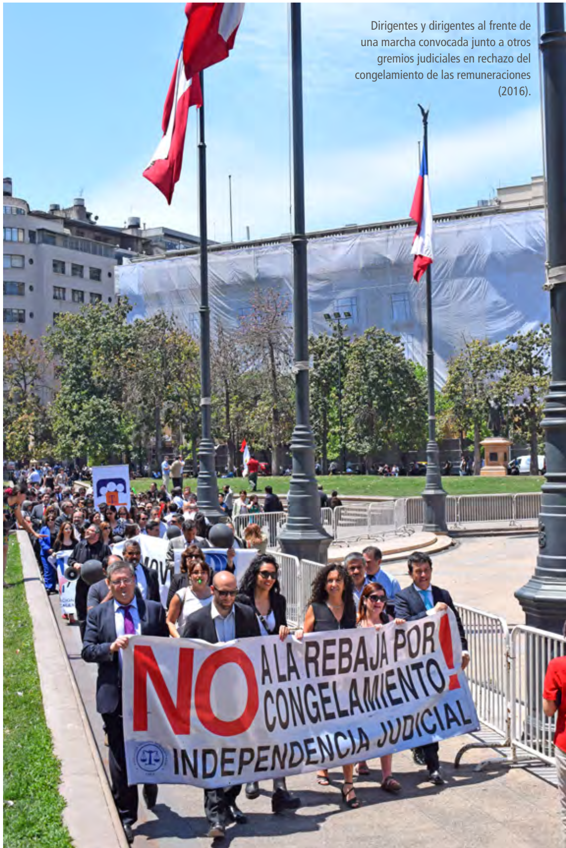
Dirigentes y dirigentes al frente de una marcha convocada junto a otros gremios judiciales en rechazo del congelamiento de las remuneraciones (2016).