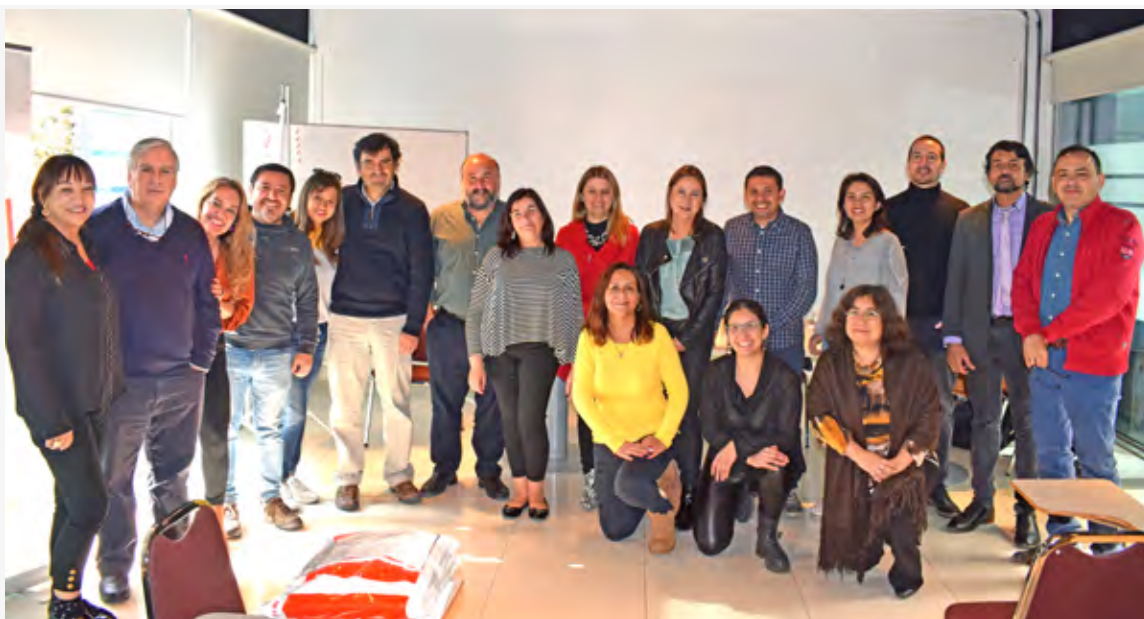
Directores/as nacionales y regionales al término de la Junta Nacional Extraordinaria en la que se abordó lo sucedido en la jurisdicción de Rancagua.

lo de su declaración los postulados y principios suscritos en la Declaración de Campeche de 2008, los cuales establecen la independencia e imparcialidad del juez, como la garantía indispensable para el ejercicio de la función jurisdiccional, e incluyó, a instancias de la delegación chilena y en un inédito hecho hasta entonces, un considerando (10°) en el que exhortó a las asociaciones miembros “a procurar y promover la creación de instancias adecuadas para la educación, prevención y erradicación del acoso sexual dentro de los poderes judiciales de nuestros países, así como cualquier otro tipo de maltrato, de acuerdo a la normativa internacional y local vigente, y del mismo modo, promover toda instancia educativa para fallar con perspectiva de género, que incorpore la elaboración de un manual de buenas prácticas que faciliten la dictación de resoluciones en esa dirección” .